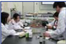
自動分析試験紙法