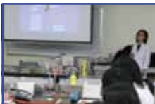
臨床検査についての講義

3月13日、岡山理科大学理学部との第2回連携講座が行われました。高校2年生・生命科学コースの生徒が受講しました。今回は、臨床生命科学科での講義・実験です。最初に臨床検査の概要を説明された後、「血液と尿、尿タンパクと固形成分」についての講義を聞き、後の実習に向けて必要な基礎知識を学びました。