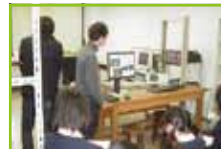
ニュートリノについての説明

2年生「数理科学課題研究」では、岡山大学理学部物理学科との連携講座を実施しています。後期に行われた講座のうち、残りの3回を紹介します。