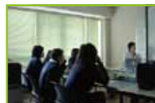
物理学の考え方の説明