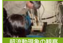
超流動現象の観察

次に、液体窒素が真空ポンプで排気することで温度が下がり固体になる様子を観察しました。その後で液体ヘリウムの温度を下げたときに起きる現象（超流動）の観察を行いました。