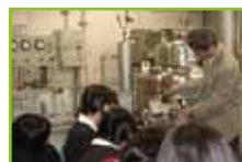
液体窒素生成の様子を観察

この実験室では、スーパーカミオカンデ（ニュートリノ検出装置）で使われている光電増幅管の性能のチェックをしています。ニュートリノについての説明を受けた後、実験で使われている大きな光電管を見せて頂きました。