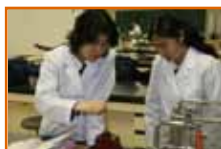
肉に含まれる色素の抽出