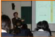
抗癌剤についての講義

12月22日、福山大学生命工学部との第3回連携講座が行われました。高校1年生・生命科学コースの生徒が受講しました。今回は、応用生物科学科での講義・実験です。午前中はプラチナを原料とした抗癌剤についての講義（プラチナを原料として作られている薬が、抗癌剤として大活躍しているが、それがどのように効力を発揮するか、またどのように開発されてきたかなど。）を受けました。