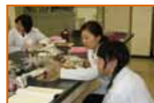
肉類の発色剤の存在を確認