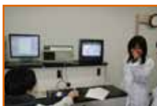
リコピンがあることを確認