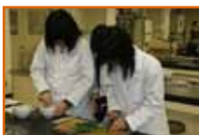
野菜から色素を抽出

午後からは野菜（トマト・ホウレンソウ）に含まれる色素（リコピンなど）の抽出と質量分析の実験と、市販の肉類によく使われる発色剤（亜硝酸ナトリウム）の検出実験を行いました。