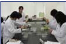
尿タンパクの抽出