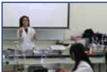
実習についての説明

講義の後、尿検査実習として、「目視試験紙法」、「自動分析試験紙法」、「尿タンパクのスルホサリチル酸法による測定」、「尿沈渣の観察（赤血球・白血球）・血液標本との違いの確認」の4つの実習を行いました。