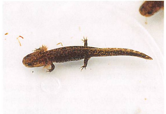
写真4. ヒダサンショウウオ幼生

ハコネサンショウウオ、ヒダサンショウウオ、プチサンショウウオは県南部では見られません。県北部の溪流にすんでいます。成体は、岩の下などに隠れるように生活しているので、なかなか目にすることはありません。幼生は溪流のやや流れの緩いところにすんでいます。ハコネサンショウウオの幼生は、県立森林公園などの施設の中で比較的たやすく見つけることができます。ハコネサンショウウオの幼生は他のサンショウウオと比べて、頭の形が角張っていて、伏し目がちな目をしています。また指先には黒い爪があります（写真3）。水温の低い山地の溪流で発育し、成長は遅く、