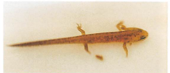
写真1. アカハライモリ幼生

有尾類にであうことは少ないですが、最も目につきやすいのはアカハライモリです。池や川の流れの緩やかな場所を注意して見ると、水底でうごめいている姿を見つけることができます。繁殖期の4月から5月には、雄を追尾している雌の姿を見つけることもあります。これは、雄が放出した